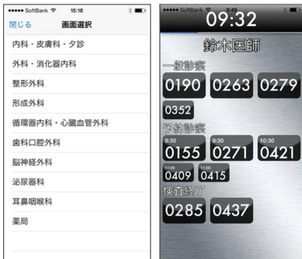
導入したスマートフォンアプリの画面 (診療科から検索し、医師ごとに確認できる仕組み)

遅過ぎず、早過ぎず、実に機をとらえていたと思っています。1か月で2000人以上の患者さんやご家族にご利用いただいています。